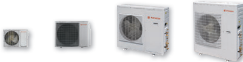
Технические характеристики на наружные блоки