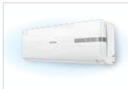
Современный стильный дизайн