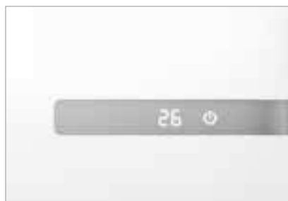
Серебристый дисплей на передней панели