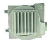
Опция: блок притока свежего воздуха O 2 Fresh (Кроме моделей 18K)