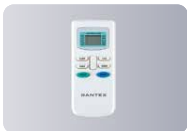
Функциональный пульт ДУ