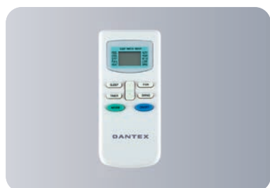
Функциональный пульт ДУ