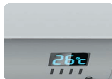
Дисплей на передней панели